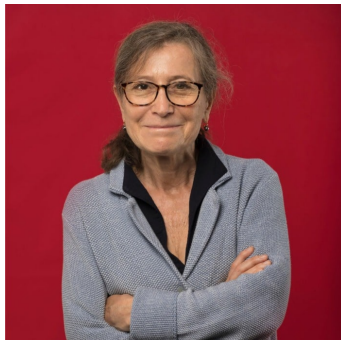
Nadine Cerf-Bensussan_Grand Prix 2023 – Institut Imagine (unité 1163 Inserm_Université Paris Cité).

Des chercheuses émérites dont le parcours est une véritable source d'inspiration pour les jeunes générations et notamment pour les jeunes femmes et jeunes filles que nous encourageons vivement à s'affranchir des freins afférents aux inégalités Femmes-Hommes et d'embrasser des carrières scientifiques pour construire un monde plus paritaire, équitable et juste !