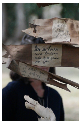
Installation suspendue © Alexia Anfry