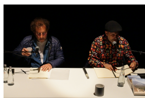
Spectacle Ne touchez pas à l'interrupteur , de Jean-Pierre Brouillaud et Pierre Blumberg