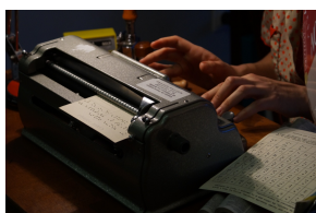
Performance Le Folâtre cabinet de Dactylographie de Cécile Hennion