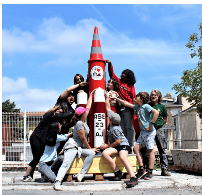
La fusée géante conçue par les jeunes de "l'Action Jeunes" de la MJC de Rieumes .